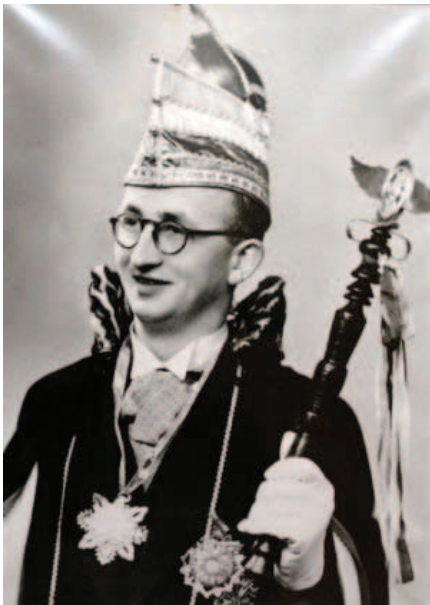
1954 Pypliano d'n Urste Jacques Huibers Nie muug mer dorst

Kijk maar eens op de site en/of in de lesbrief die daar over gaat. Enkele voorbeelden zie je hieronder.