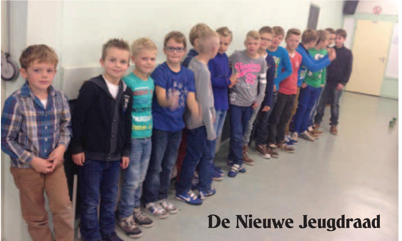
De Nieuwe Jeugdraad