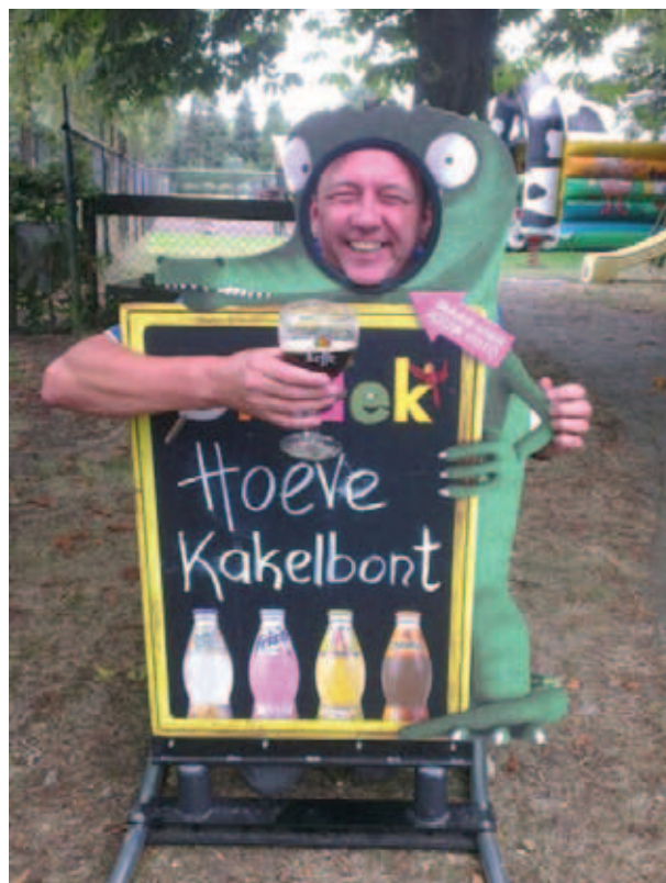
Tja... Wa moete daor mee